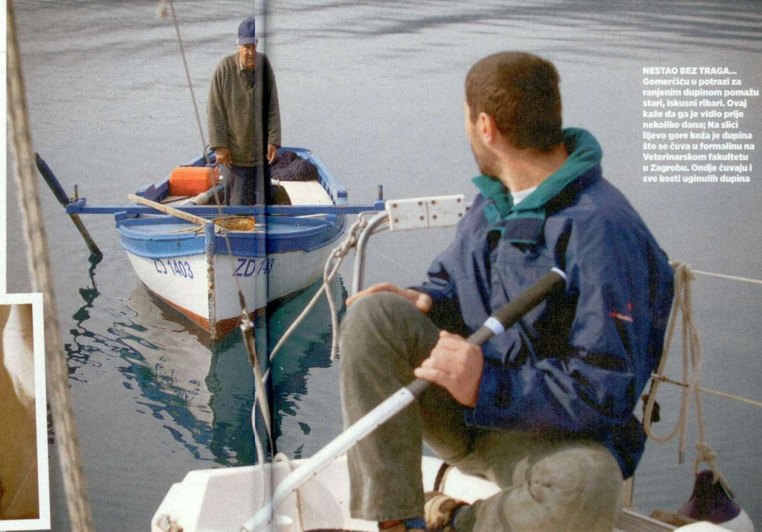
NESTAO BEZ TRAGA... Gomerčiću u potrazi za ranjenim dupinom pomažu stari, iskusni ribari. Ovaj kaže da ga je vidio prije nekoliko dana; Na slici lijevo gore koža je dupina što se čuva u formalinu na Veterinarskom fakultetu u Zagrebu. Ondje čuvaju i sve kosti uginulih dupina

“NEKE REDOVITO SUSREĆEMO VEĆ SEDAM, OSAM GODINA. PREPOZNAJEMO IH PO OŽILJCIMA. OVAJ ŠTO GA TRAŽIMO MOGAO BI BITI JEDAN ZA KOJEG ZNAMO DA IMA JAKO OŠTEĆENU PERAJU. PRAVO JE ČUDO AKO JE JOŠ ŽIV...”