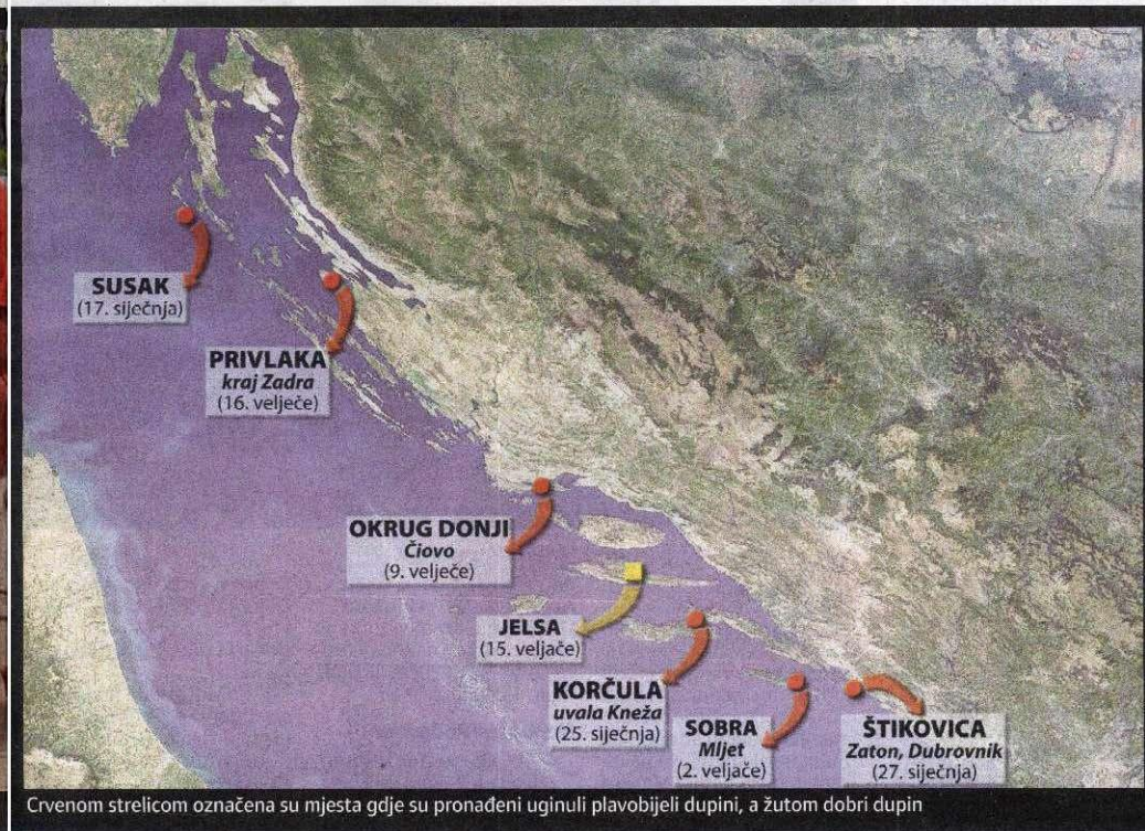
Crvenom strelicom označena su mjesta gdje su pronađeni uginuli plavobijeli dupini, a žutom dobar dupin

plavobijela dupina. Najnovija uginuća tih dupina, koji inače nisu tako česti stanovnici našega mora, upućuju na epizootiju, dakle oboljenja i uginuća od neke zarazne bolesti. U razdoblju od 1990. do 1992. evidentirana su njihova masovna uginuća u Sredozemlju zbog morbillivirusa, a da bi eventualno i sada potvrdili taj uzrok stradanja, moramo napraviti dodatne pretrage - rekao je doc. dr. sc.