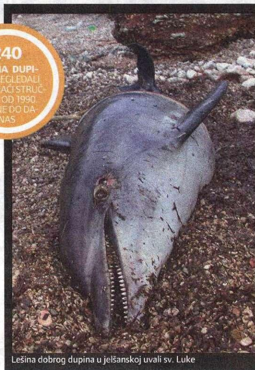
Lešina dobrog dupina u jelšanskoj uvali sv. Luke

- U hrvatskom dijelu Jadrana godišnje stradaju prosječno tek jedan do tri