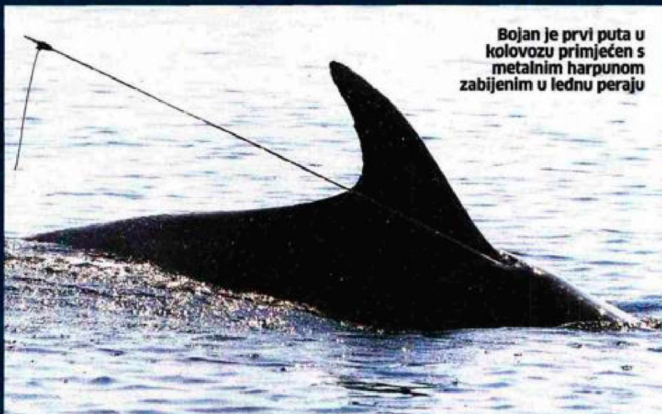
Bojan je prvi puta u kolovozu primijećen s metalnim harpunom zabijenim u lednu peraju