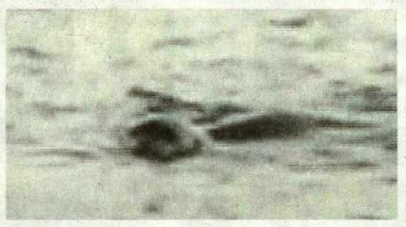
Creski kapetan duge plovidbe Dubravko Filipas i Aleksandar Đurendić snimili su medvjedicu