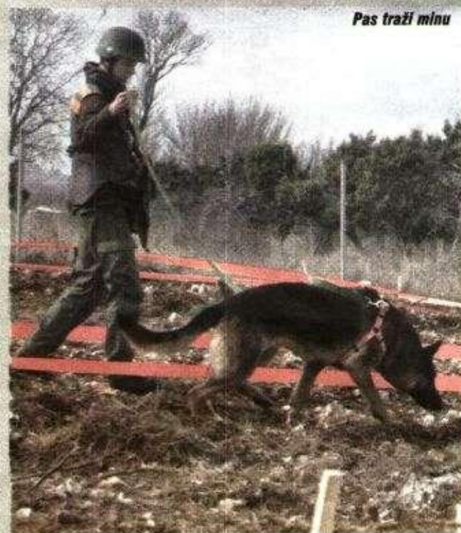
Pas traži minu

Mještani su rekli da im je drago što se napokon počelo s razminiranjem jer ih je najviše bilo strah za sigurnost djece.