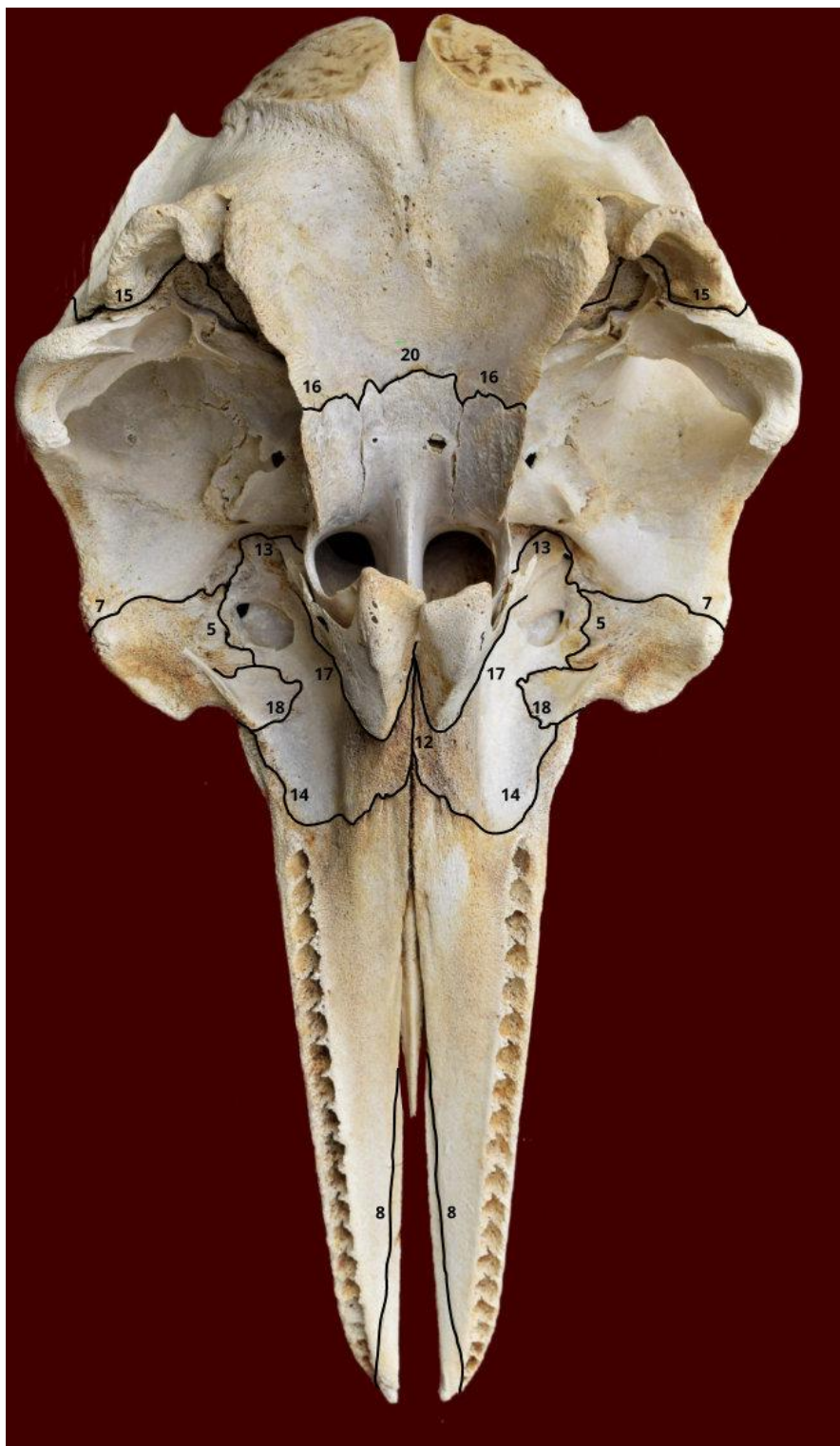
Slika 4. Lubanja dobrog dupina iz Jadranskog mora - norma ventralis. Označeni su sljedeći šavovi: sutura lacrimomaxillaris (5), sutura frontolacrimalis (7), sutura maxilloincisiva (8), sutura palatina mediana (12), sutura palatomaxillaris (13), sutura palatina transversa (14), sutura occipitomastoidea (15), sutura pterygosphenoidalis (16), sutura pterygopalatina (17), sutura zygomaticomaxillaris (18) i sutura vomerosphenoidalis (20).