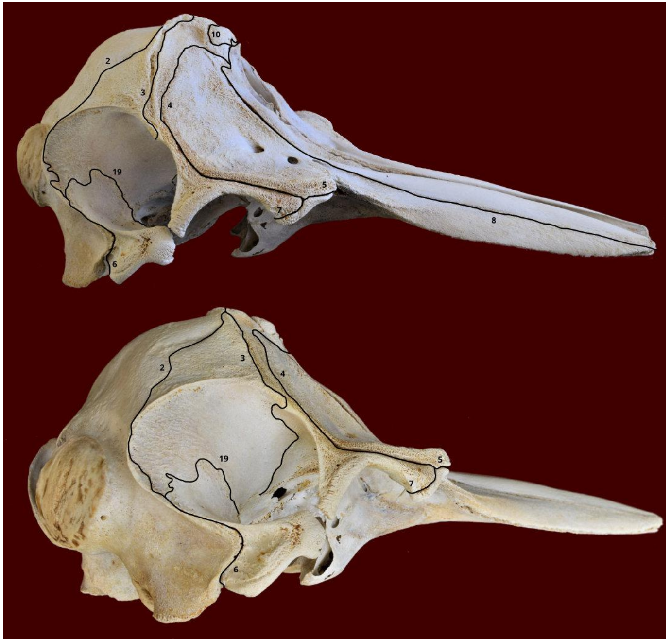
Slika 3. Lubanja dobrog dupina iz Jadranskog mora - norma lateralis (gore i dolje). Označeni su sljedeći šavovi: sutura lambdoidea (2), sutura coronalis (3), sutura frontomaxillaris (4), sutura lacrimomaxillaris (5), sutura occipitosquamosa (6), sutura frontolacrimalis (7), sutura maxilloincisiva (8), sutura frontonasalis (10) i sutura squamosa (19).