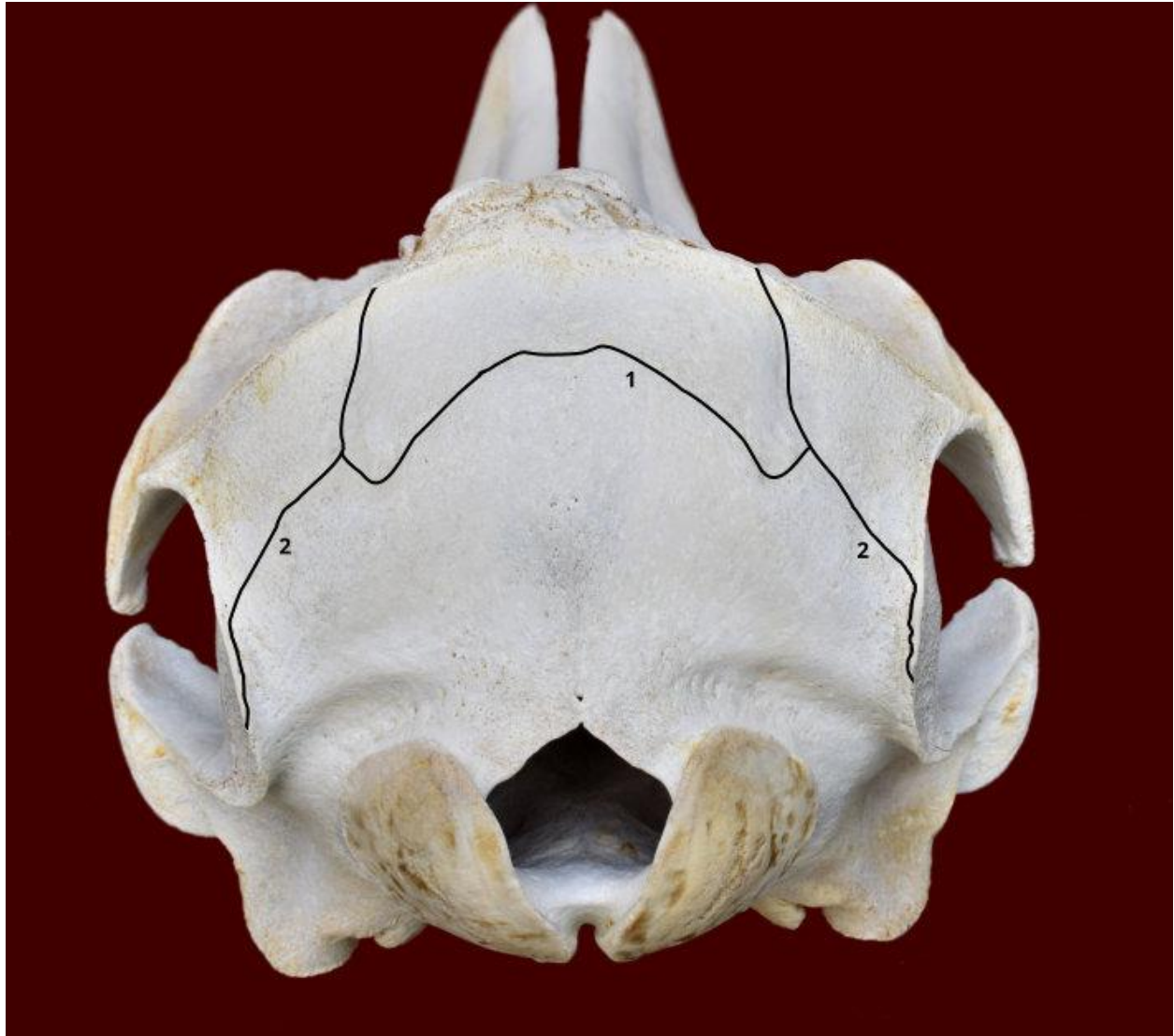
Slika 1. Lubanja dobrog dupina iz Jadranskog mora - norma caudalis. Označeni su sljedeći šavovi: sutura occipitointerparietalis (1) i sutura lambdoidea (2).

Uslijed odstupanja od položaja kostiju glave, koji je uobičajen za većinu domaćih i ostalih kopnenih sisavaca, u dobrog dupina uočene su znatne razlike u položaju šavova lubanje. Položaj šavova na lubanji dobrog dupina nije dosada opisan te su u okviru ovog istraživanja izrađene fotografije lubanja i ucrtani determinirani šavovi (slika 1, 2, 3 i 4)